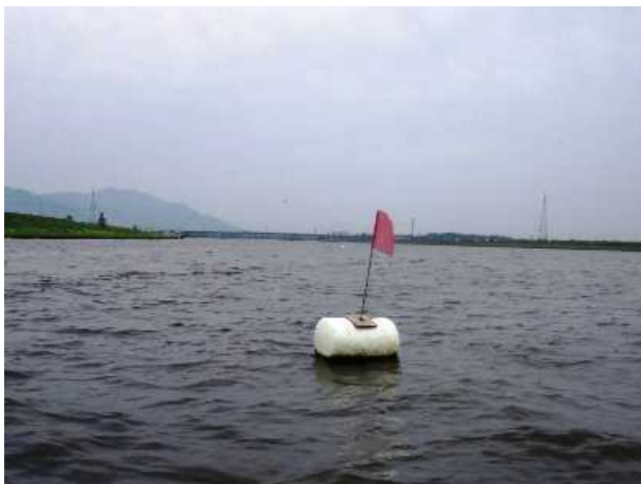
白ブイ 浚渫船を囲むように 4 箇所設置している。